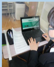
〈Chromebookを用いた調べ学習〉