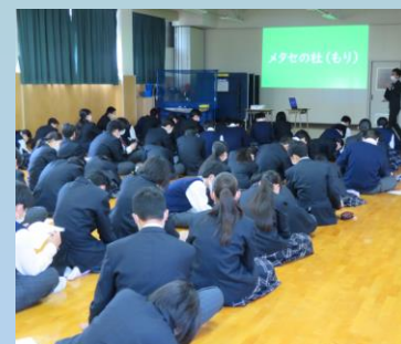
〈地域について知る活動〉

地域活性化の講演会を聴くこと、地域について調べることで、築上町の様々な施設に実際に足を運ぶフィールドワークを通して、築上町の「魅力」を発見する活動。